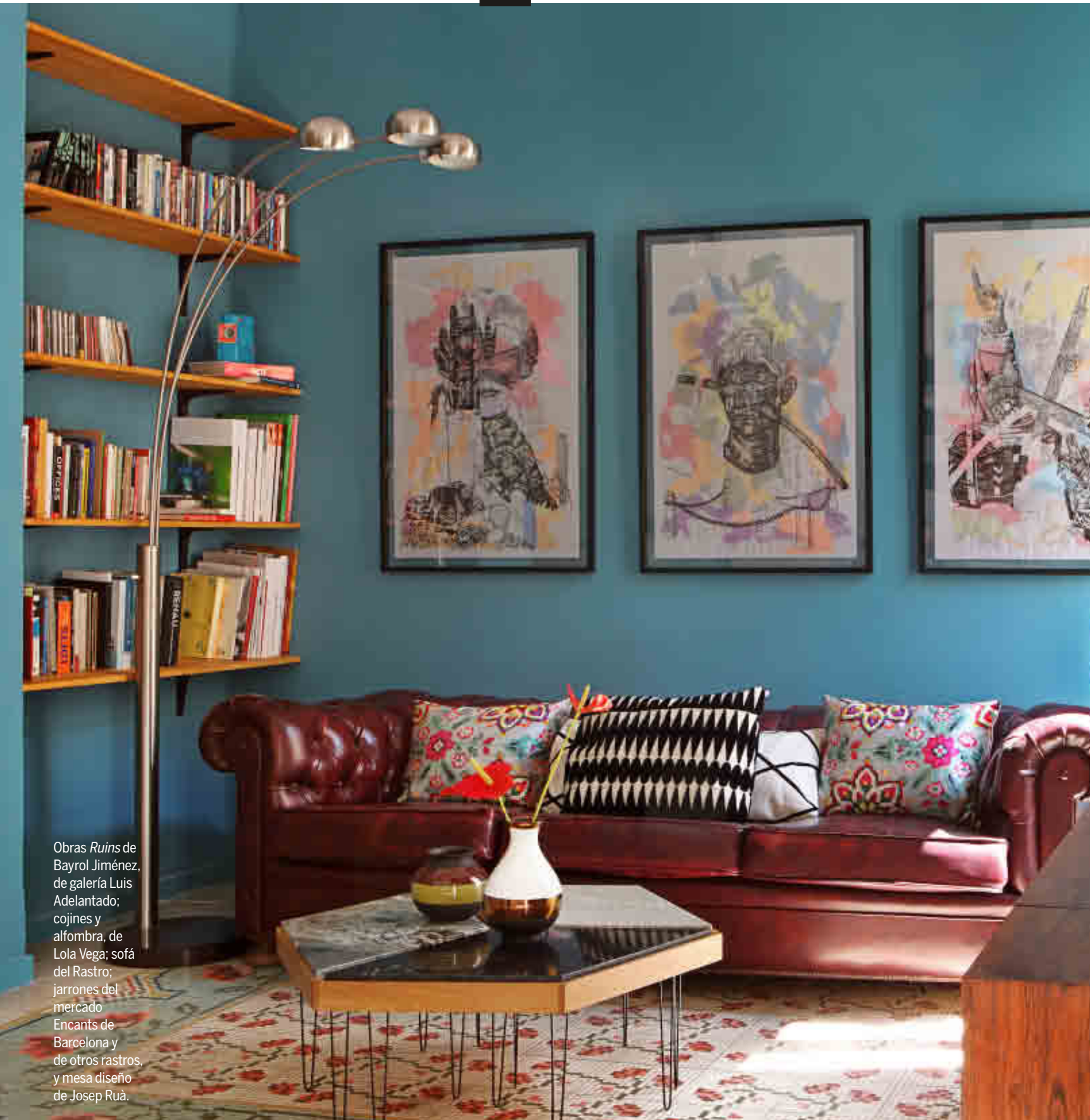
Obras Ruins de Bayrol Jiménez, de galería Luis Adelantado; cojines y alfombra, de Lola Vega; sofá del Rastro; jarrones del mercado Encants de Barcelona y de otros rastros, y mesa diseño de Josep Ruà.

Josep Ruà i Blasco diseñador y arquitecto de interiores