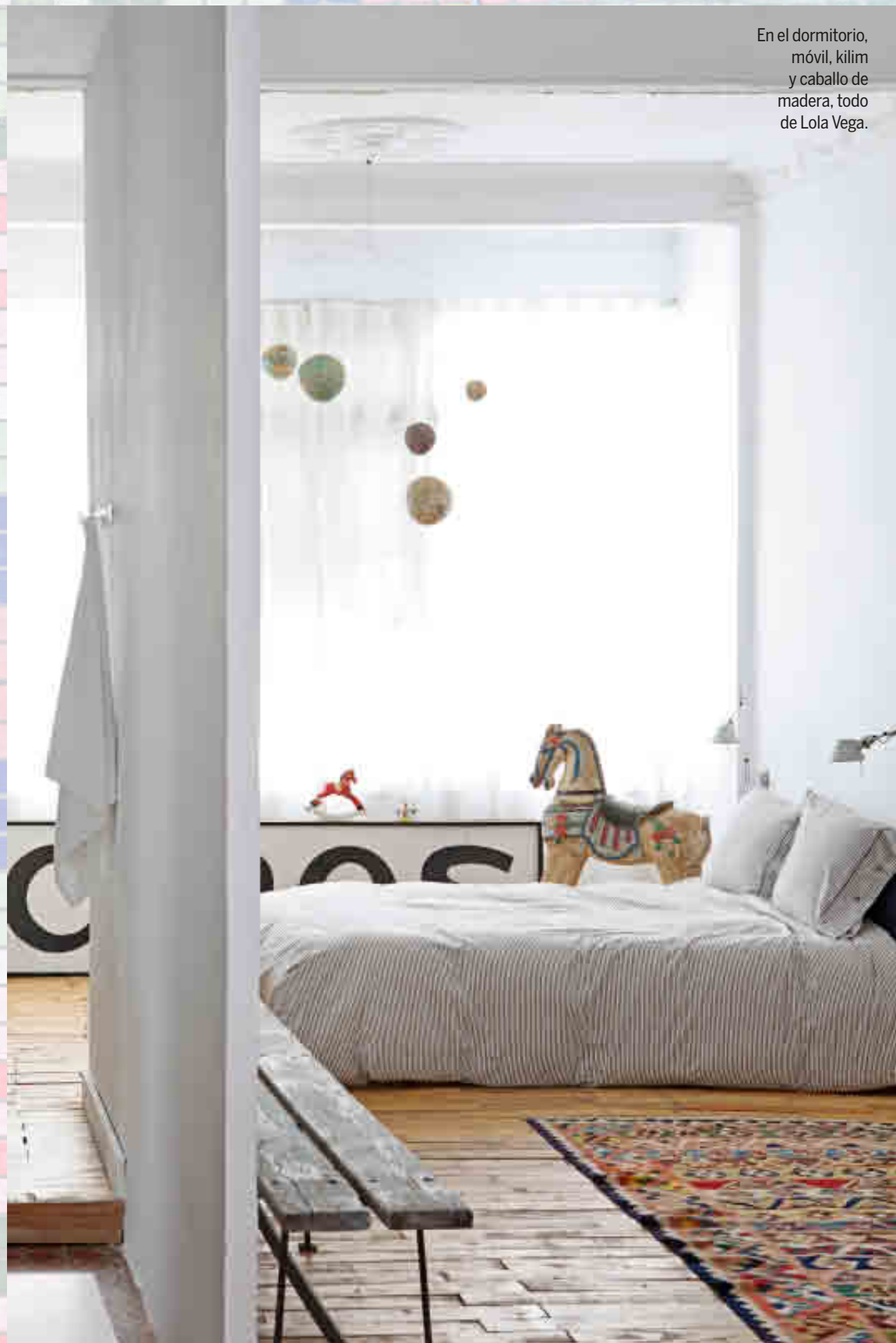
En el dormitorio, móvil, kilim y caballo de madera, todo de Lola Vega.