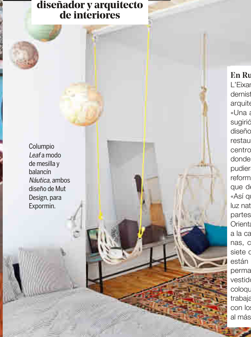
Columpio Leaf a modo de mesilla y balancín Náutica , ambos diseño de Mut Design, para Expormin.

Texto Teresa Iturralde